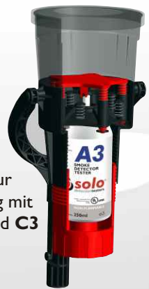
Solo 330 zur Verwendung mit Solo A3 und C3 Aerosolen