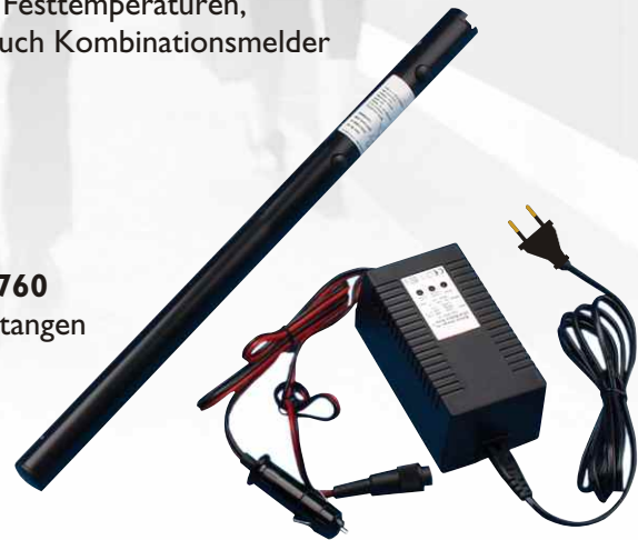
Solo 725 Schnellladegerät