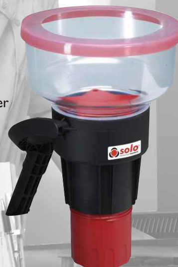
Solo 332 Aerosol Spender

Der Solo 332 steht zur Prüfung größerer Melder zur Verfügung.